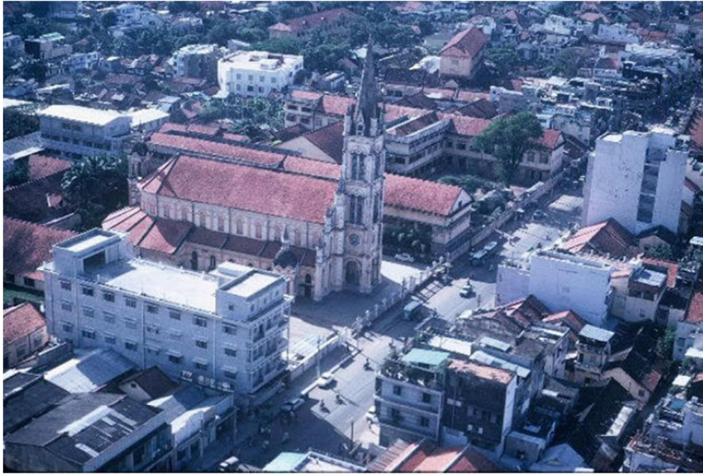
Nhà thờ Tân Định và trường Thiên Phước, thập niên 1960

Nhà thờ Tân Định có tên chính thức là Nhà thờ Thánh Tâm Chúa Giêsu, xây dựng vào năm 1870 trên vùng đất xưa thuộc thôn Phú Hoà của đất Gia Định. Vùng đất này trước đó được xem là vùng đất ngoại ô khi người Pháp chiếm thành Gia Định. Sau chiến tranh, một số dân ngụ cư tại đây di cư về vùng đất mới bao gồm hai thôn Phú Hoà và Xuân Hoà. Từ đó vùng đất này được mang tên mới, Tân Định.