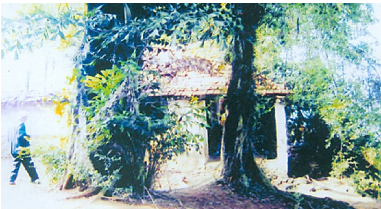
Đền thờ nữ đại tướng Bát Nàn ở Việt Trì, tỉnh Phú Thọ (Trước khi trùng tu)

Một thời gian sau, theo đề nghị của địa phương, cấp trên cho một phần kinh phí, nhân dân đóng góp một phần để trùng tu. Thế là nảy sinh ra hai loại ý kiến, không thể khởi công được. Một bên là giao cho các nhà thầu. Một bên là các cụ hội người cao tuổi sợ tiền ít mà thất thoát tiêu cực thì không xong, nên các cụ muốn được trực tiếp nhận trách nhiệm trùng tu. Trong khi đang tranh cãi, một con rắn trắng xuất hiện nằm tại đền, mưa nắng, ngày đêm không đi đâu. Dân làng nấu xôi, gà ra cúng, lấy ô ra che mưa che nắng... Cả chủ thầu và toán thợ sợ quá bỏ đi. Sau đó, được chính quyền giúp đỡ, các cụ hội người cao tuổi đảm nhiệm - rắn đi. Chúng tôi lại đến khảo sát, miếu thờ đã được xây dựng khang trang, có tiền sảnh, minh đường rất đẹp. Thỉnh thoảng rắn vẫn đi qua cửa đền.