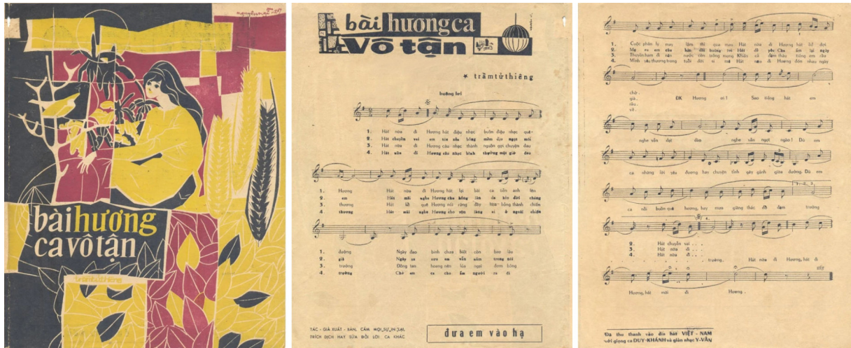
Bìa nhạc phẩm “Bài Hương Ca Vô Tận” của nhà phát hành Minh Phát năm 1967. (Hình: Tài liệu)

SANTA ANA, California (NV) – “Hát nữa đi Hương, hát điệu nhạc buồn điệu nhạc quê hương/ Hát nữa đi Hương, hát lại bài ca tiễn anh lên đường...”