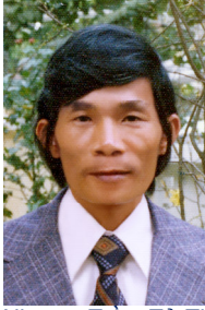
Nhạc sĩ Trầm Tử Thiêng chụp vào Tết năm 1975.

Nhìn em ca thấy cả một trời hoa mộng, đôi môi em mấp máy dịu dàng và làn tóc mềm mượt bằng bồng bình như chơi vơi trên bờ vai em rung động nhẹ nhàng, vậy thì cứ hát mãi nghe em, để cho má em thêm tươi hồng và để cho người em giữ mãi nét thanh xuân: “Hát chuyển vai em tóc xoắn bồng mềm, dịu ngọt môi em/ Hát mãi nghe Hương cho hồng làn da kéo đời chóng già...”